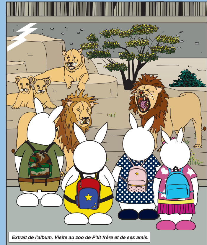
Extrait de l'album. Visite au zoo de P'tit frère et de ses amis.

Hermanito es el último hijo nacido en la familia MUT. En un escenario a quitar el aliento, lleno de suspense, su primera aventura hace temblar de miedo a los portadores de pañales: él acaba de perder a su dudú. Nuestro nuevo héroe va a buscarlo. Esta búsqueda lo lleva a visitar todas las piezas de la casa y encontrar todos los miembros de su familia. Sin revelar el final, la historia se termina bien... ¡¡Uff!!